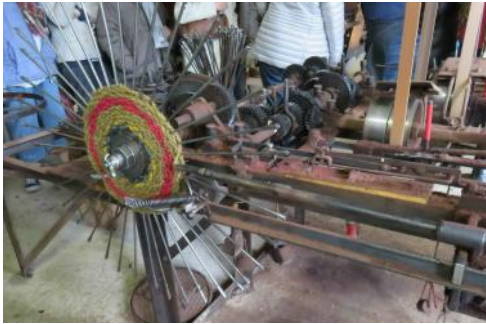
Nyons – Scourtinerie

Et puis déjà le quatrième et avant-dernier jour. Départ matinal pour Nyons et la Drôme provençale.