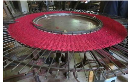
Nyons – Scourtinerie

Visite intéressante et commentée de la dernière scourtinerie (fabrique traditionnelle de filtres à huile et tapis provençaux) en activité de France avant un temps libre sur le marché de Nyons.