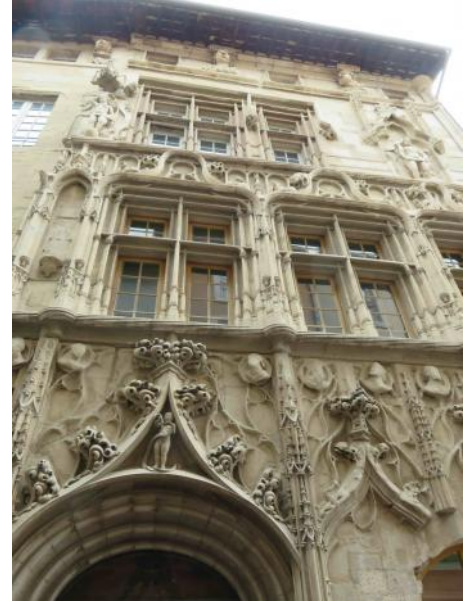
Valence – Façade du vieux Valence

Et puis déjà le quatrième et avant-dernier jour. Départ matinal pour Nyons et la Drôme provençale.