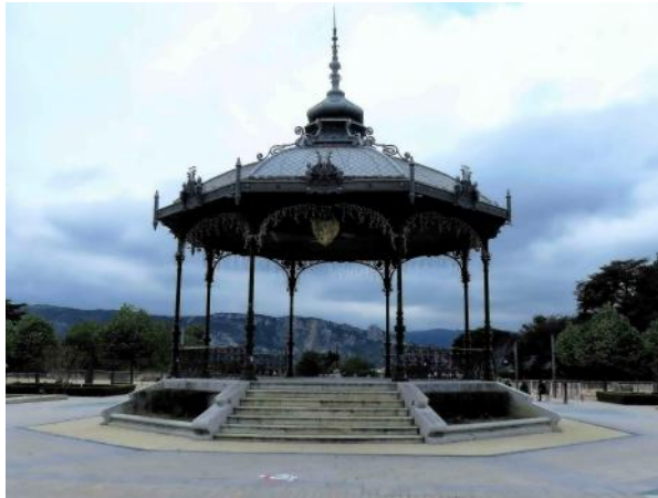
Valence – Kiosque Peynet