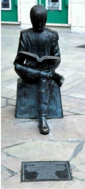
Valence – Napoléon

L'après-midi, visite commentée et guidée du vieux Valence. Valence, ville que l'on connaît peu de l'intérieur et dont on ne retient souvent que le nom sur la route des vacances vers le Midi.